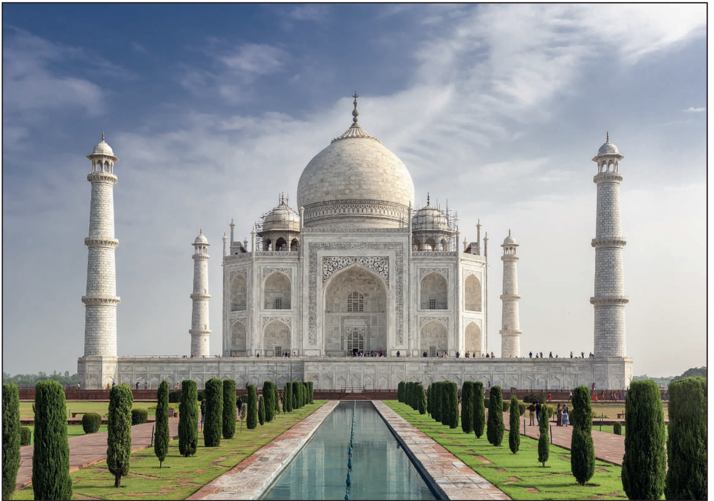
ARTE (#14) - www.oiler.education