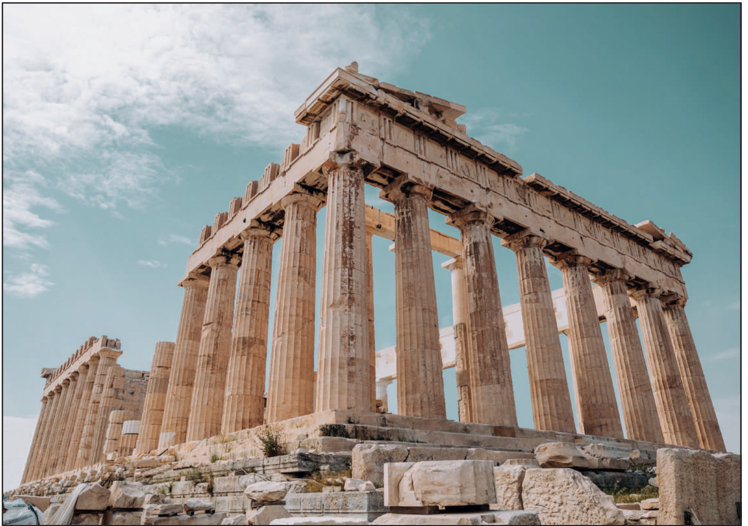
ARTE (#19) - www.oiler.education